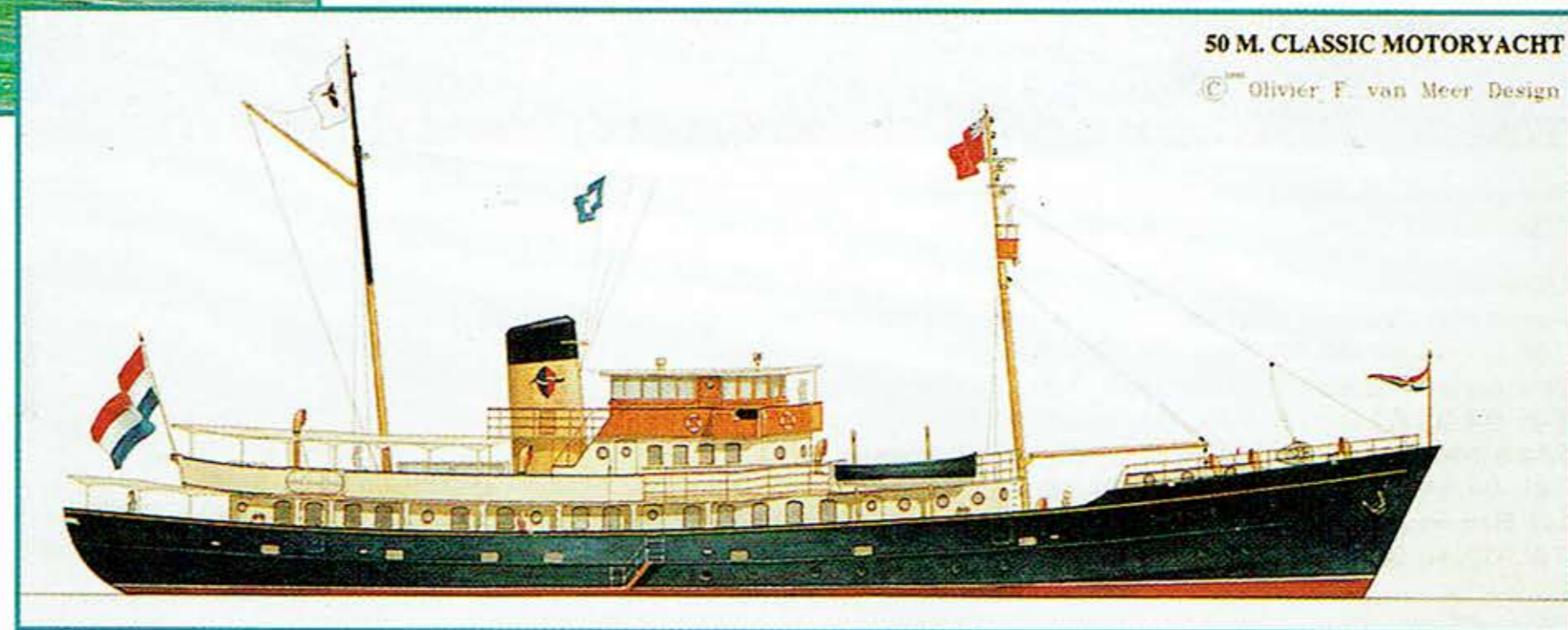
50 M. CLASSIC MOTORYACHT

manœuvrée par trente-six novices, comme au temps de la marine à voile. Au programme, participer aux grands rassemblements, et voyages formateurs autant qu'initiatiques